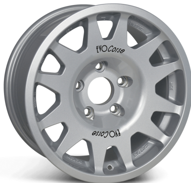
IMAGE IS FOR COLOUR ILLUSTRATION PURPOSES ONLY MODELLO IN FOTO SOLO PER RIFERIMENTO COLORE