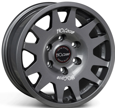
IMAGE IS FOR COLOUR ILLUSTRATION PURPOSES ONLY MODELLO IN FOTO SOLO PER RIFERIMENTO COLORE