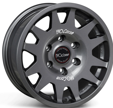
IMAGE IS FOR COLOUR ILLUSTRATION PURPOSES ONLY MODELLO IN FOTO SOLO PER RIFERIMENTO COLORE

Référence : SE5220061041 Prix : 368,00 € TTC/Pièce