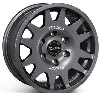
IMAGE IS FOR COLOUR ILLUSTRATION PURPOSES ONLY MODELLO IN FOTO SOLO PER RIFERIMENTO COLORE