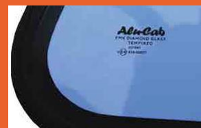
Vitrage norme européenne