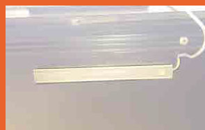
Éclairage intérieur LED