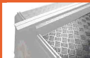
Toit en alu strié anti-dérapant