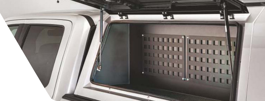
Tiroir latéral complet: occupe tout l'espace de l'une des portes latérales et comprend des panneaux Molle pour sécuriser la cargaison.