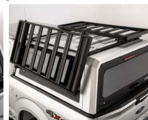
GALERIE DE TOIT (re)PLIANTE