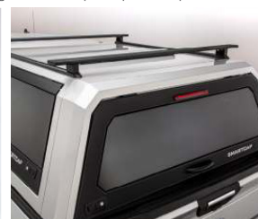
BARRES DE CHARGEMENT