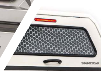
GRILLE DE SÉCURITÉ (EVOc)