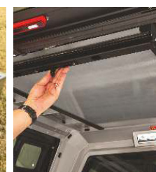
TABLE DE TOIT PLIANTE