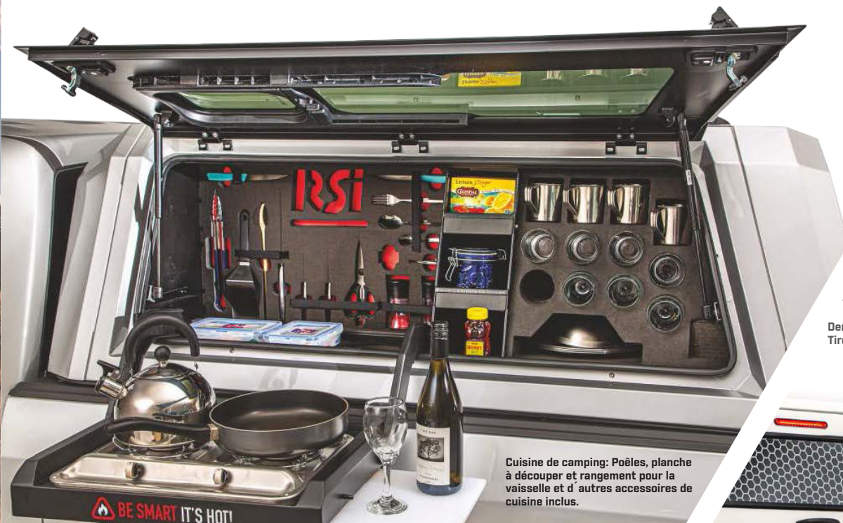
Cuisine de camping: Poêles, planche à découper et rangement pour la vaisselle et d'autres accessoires de cuisine inclus.