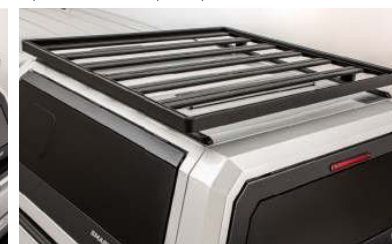
GALERIE DE TOIT FIXE

Galerie de toit de travail: support robuste avec des rouleaux de chargement et de nombreux points d'arrimage, pour sécuriser la charge. Barres de chargement: idéales pour monter des tentes de toit, des vélos, des échelles, etc. Galerie de toit (re)pliable: Ce système de galerie de toit peut s'abaisser d'un côté pour faciliter le chargement et le déchargement de quoi que ce soit. Galerie de toit fixe: avec une large surface et plusieurs rails d'arrimage pour sécuriser notre cargaison.