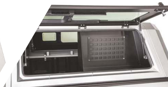
Demi-tiroir: Il n'occupe que la moitié de l'espace disponible, laissant l'autre moitié pour l'accès à l'intérieur du toit rigide et à la charge. Tiroir à outils: organisez et transportez vos outils et équipements en toute sécurité.