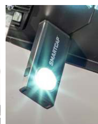
LAMPE DE POCHE PORTABLE