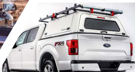
GALERIE DE TOIT DE TRAVAIL

Grille de sécurité (EVOc): Ajoutez un autre niveau de sécurité à la vitre arrière de votre Smartcap EVOc. Lampe de poche portable: puissante et compacte lampe de poche LED rechargeable par USB, avec base magnétique et régulateur d'intensité pour éclairer exactement là où vous en avez besoin. Barbecue SMARTCAP: Barbecue portable et pliable en acier inoxydable, il peut également être utilisé comme centre de feu de camp. Table de toit pliante: Construction en acier inoxydable, comprend des supports de montage sur le toit pour que vous puissiez la ranger et l'attacher solidement sans prendre de place dans votre pick-up.