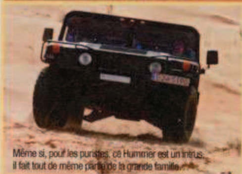
Même si, pour les puristes, ce Hummer est un intrus, il fait tout de même partie de la grande famille.