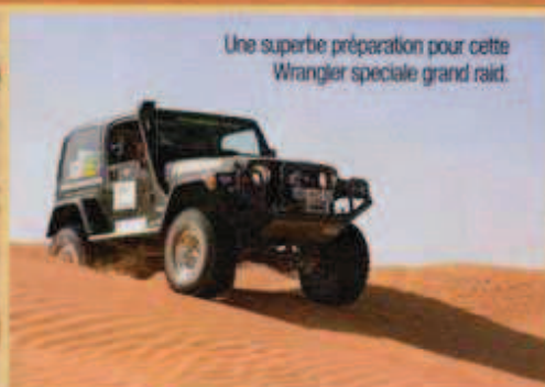
Une superbe préparation pour cette Wrangler spéciale grand raid.