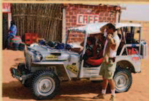
Après une longue balade dans les dunes arides, rien ne vaut une pause au bistrot local.