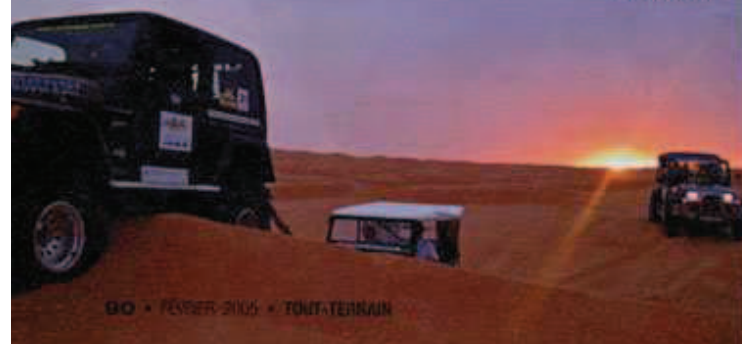
Plusieurs générations se côtoient dont cette antique Willys aux jantes peu orthodoxes...