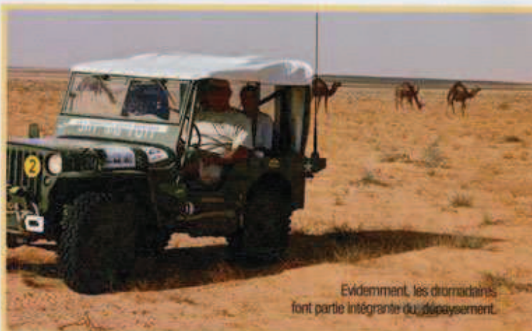
Evidemment, les dromadaires font partie intégrante du déplacement.

Après une longue balade dans les dunes arides, rien ne vaut une pause au bistrot local. Ci-dessous : une façon peu commune de faire le plein... les jerrycans ne sont pas fournis!