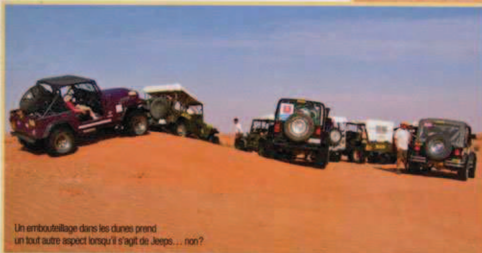
Un embouteillage dans les dunes prend un tout autre aspect lorsqu'il s'agit de Jeeps... non?