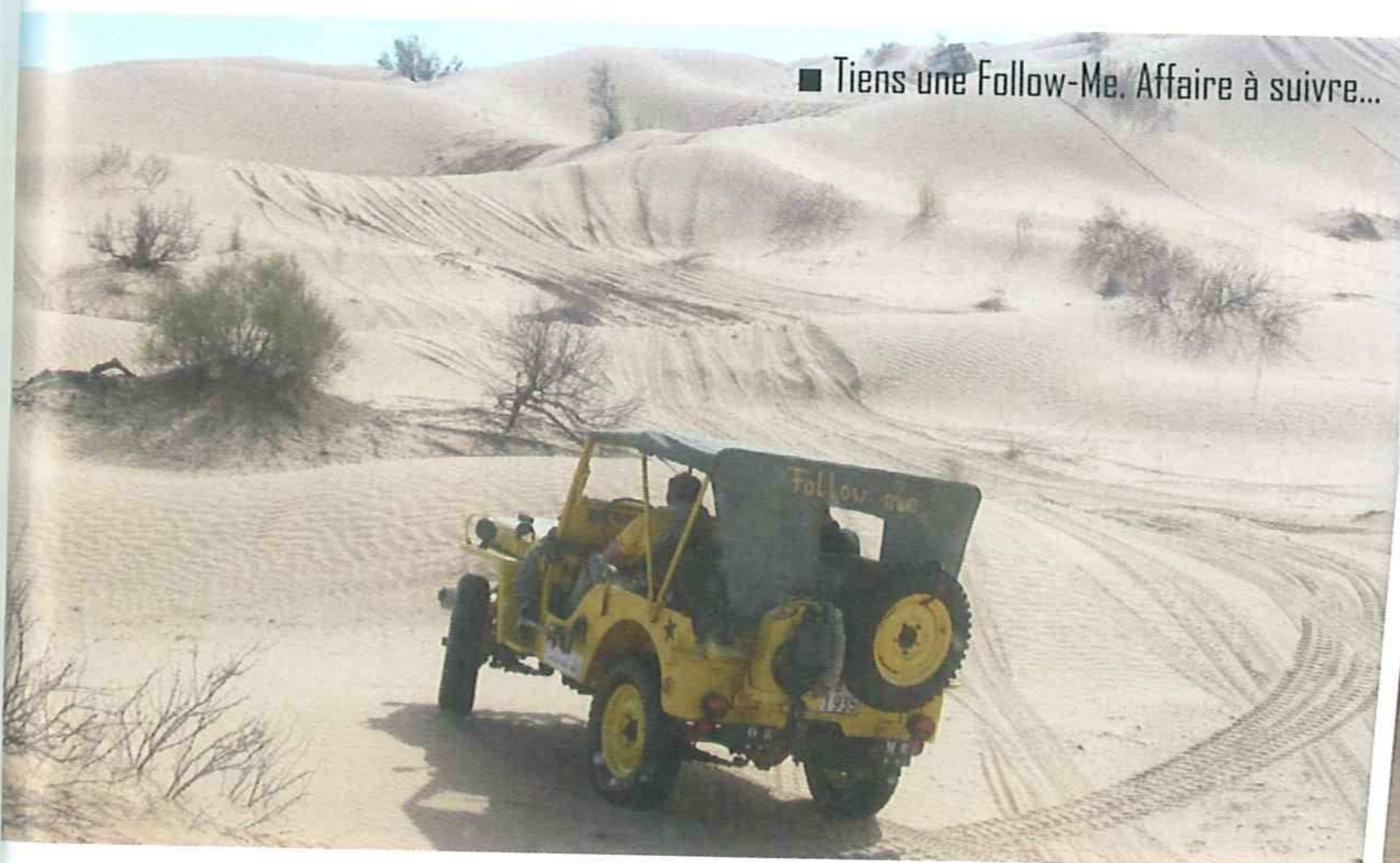
■ Tiens une Follow-Me. Affaire à suivre...

montagnes. Une dernière nuit et le jour suivant, l'aventure se terminait; le groupe qui ne poursuivait pas l'aventure en Libye puis en Égypte embarqua pour Marseille. Mais ce fut avec de grands sourires que les participants se quittèrent, avec les souvenirs du voyage gravés à jamais dans leur mémoire et l'envie de recommencer cette année. Inch Allah... ■