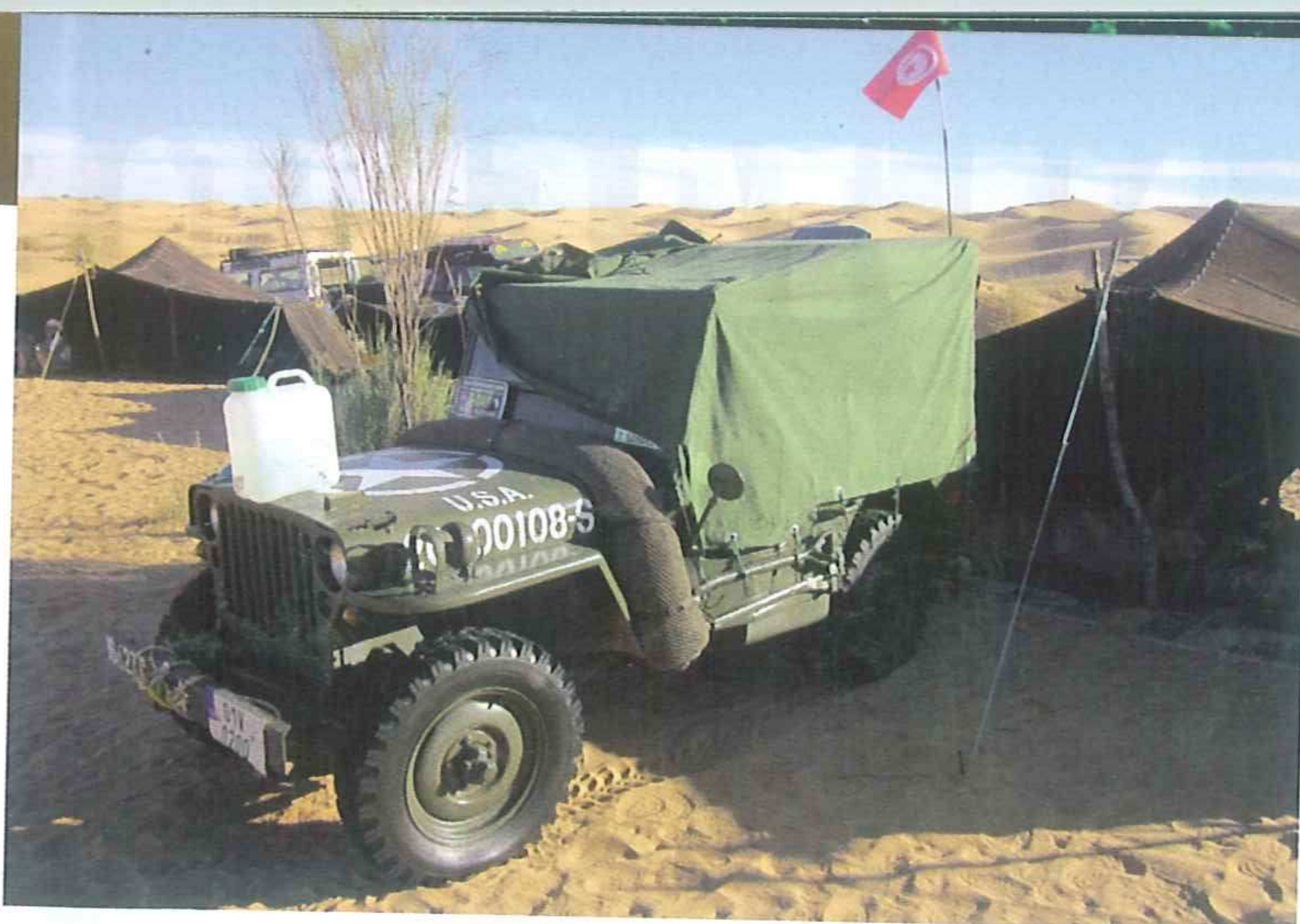
■ Couverture nocturne pour la rosée et la poussière.

dîner touareg attendait le groupe au campement Hédi Bel Hadj, avec de belles surprises. Déjà une semaine que l'aventure avait commencé et il était temps de quitter le désert et de repartir avec de beaux paysages en tête... Retour à la civilisation pour un peu de repos et quelques emplettes. Le raid se dirigea ensuite vers Hammamet par l'ouest du pays où il devait longer les