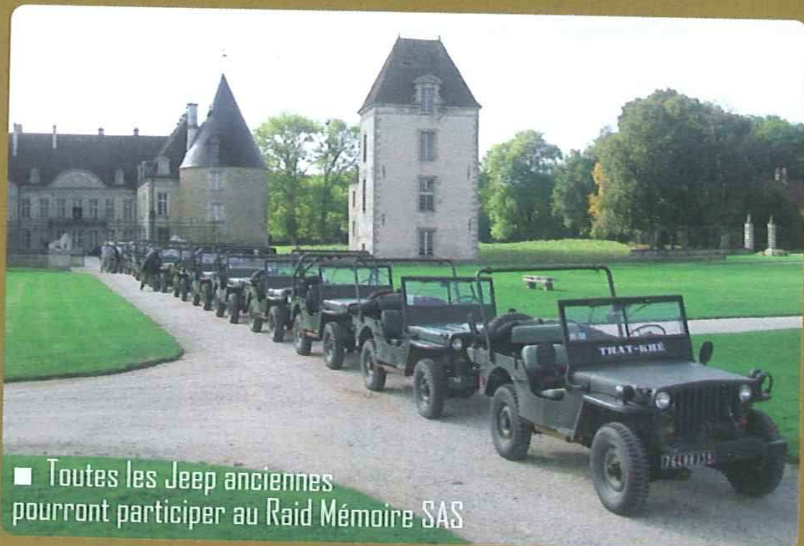
■ Toutes les Jeep anciennes pourront participer au Raid Mémoire SAS

■ Jeep SAS anglaise de 1944 officiant en France