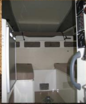
Banquettes 4 adultes