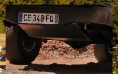
Emplacement pour réservoir supplémentaire