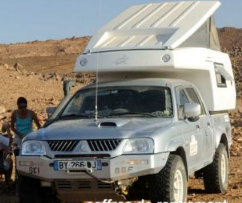
coffres de rangement