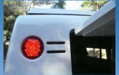
Feux arrière à LED