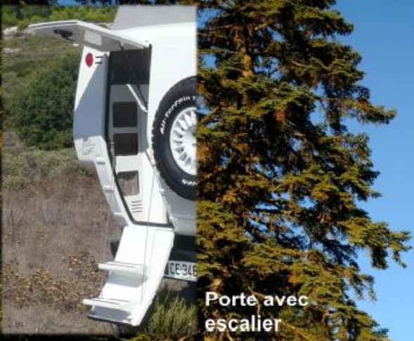
Porte avec escalier