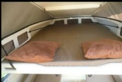
Lit en capucine 140/195