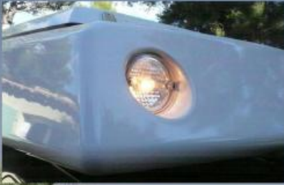
Phares avant d'aide au travail