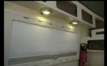
Eclairage à LED