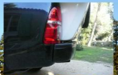
Pas de porte à faux