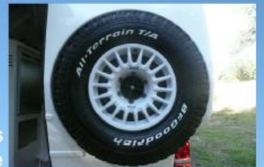
Roue de secours encastrée