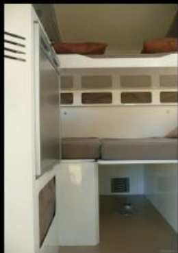
Lit bas 115/165